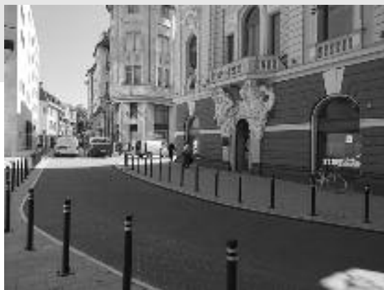
nom smeru. Ova promena braćaja i bolju organizaciju pruža efikasniji protok sa- u ovom delu grada.

Deo ulice Braće Radić sada funkcioniše kao jednosmerna iz pravca Maksima Gorkog, ulazi polukružno kod biblioteke u Ulicu cara Dušana i nastavlja nazad prema Maksima Gorkog ili levo prema Vladimira Nazora, i to u jednom smeru. Ova promena braćaja i bolju organizaciju pruža efikasniji protok sa- u ovom delu grada.